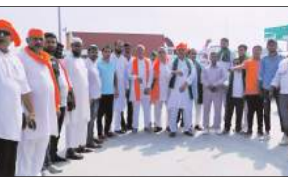
चित्र परिचय-मेरठ महापंचायत में शामिल होने के लिए पहुंचे भाकियू चढ़नी के स्थानीय पदाधिकारी।

महापंचायत 8 - किसान महापंचायत में बिजली, निराश्रित गोंवंधा, एमएसपी के मुद्दे उठाए गए