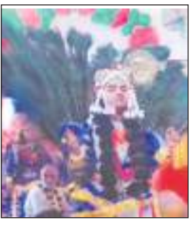
सखियां इस विचित्र मोर के रूप रंग का वर्णन और इस मोर की महिमा का गायन करती हैं। श्रीराधारानी द्वारा मोर भगवान को लड्डू भोग लगाया जाता है। भक्तों को प्रसाद लुटाए जाते हैं। हजारों की संख्या में इस महाप्रसादी लड्डू को लुटने की होड़ भक्तों में लगी

मथुरा/टीएम एक्शन इंडिया ऐसी कोकिला अलावत पेपया देत स्वर ऐसे मेघ गरज मुद्रंग बजावत। रसिक शिरोर्मण स्वामी हरिदास का यह पद श्याम सुंदर की मयूर लीला को दर्शाता है। पांच हजार वर्ष पूर्व द्वारप काल की लीलाओं के दर्शन आज भी ब्रज में जगह जगह देखने को मिलते हैं। मयूर लीला बरसाना के ब्रह्मांचल पर्वत पर स्थित प्राचीन लीला स्थलों में रोकुटी पर श्रीराधारानी के जन्माभिषेक अगले दिन होती है। लीला में स्वयं भगवान श्रीकृष्ण मोर बन श्री वृषभानु नदिनी श्रीराधा के कर कमलों से मेवा, लड्डू आदि का भोग लगाते हैं। श्रीराधारानी की