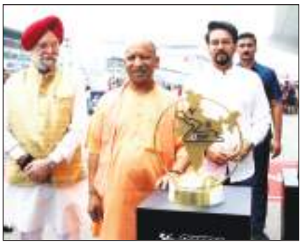
उत्तर प्रदेश के मुख्यमंत्री योगी आदित्यनाथ, केंद्रीय मंत्री अनुराग ठाकुर, हरदीप सिंह पुरी 'मोटो जीपी भारत' के ट्रॉफी के साथ।