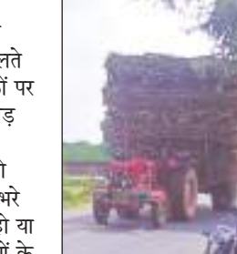
बावजूद एआरटीओ और पुलिस इस ओर ध्यान नहीं दे रहे हैं। ओवरलोड वाहन चालकों की नकेल नहीं कसी जा रही है। अफसरों की मानें तो नियमानुसार इस तरह के कार्य में लगे वाहनों

का रजिस्ट्रेशन कार्मिष्य में होता है। जबकि सामानत: ट्रैक्टर केवल कृषि कार्यों को करने के लिए हो सकता है, लेकिन फिर भी नौहड्डी क्षेत्र में लकड़ी और ईंट भट्टे का ज्यादा कारोबार होने के चलते इस क्षेत्र में अवैध रूप से ट्रालों का संचालन हो रहा है। इन ट्रालों से ज्यदा ईंट भट्टे से तादात से अंधान ईंट भट्टे कर लिया जाता है। इसके अलावा लकड़ी एवं अन्य सामान भी इन ट्रालों में खूब ढोया जा रहा है। इन ट्रालों में लकड़ी इस करर भरी होती है कि इसमें आगे और पीछे का कुछ भी नहीं दिखाई देता।